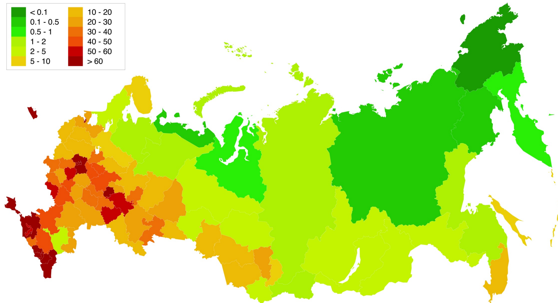
Приложение 1. Плотность населения (человек на квадратный километр).